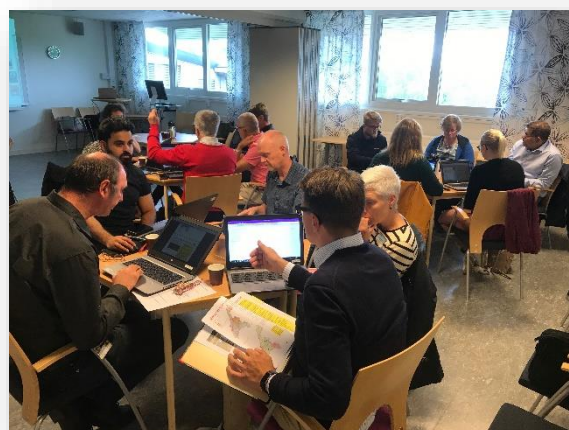
Fotona är tagna under workshopen med förvaltningar och bolag den 4 september 2019.