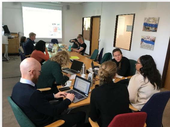
Fotot är taget under workshopen med Avdelningen för hållbar utveckling den 10 september 2019.

Den tredje workshopen hölls den 11 september med kommunstyrelsen. Totalt deltog 15 politiker, som delades in i fem diskussionsgrupper. Under workshopen fick deltagarna ta ställning till om de 247 politiska ställningstagande som finns redovisade i ÖPI6 fortfarande är aktuella.