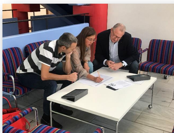
Fotona är tagna under workshopen med kommunstyrelsen den 11 september 2019.