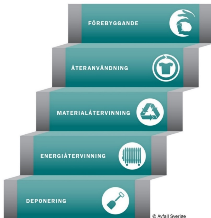
Figur 1. Avfallstrappan

Avfallsplanen avser att skapa en gemensam plattform för kommunalförbundet och dess medlemskommuner, i syfte att utveckla en miljö- och serviceinriktad avfallshantering utifrån EU:s avfallshierarki, som åskådliggörs via den så kallade avfallstrappan.