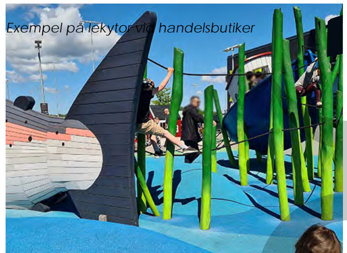
Exempel på lekytor vid handelsbutiker