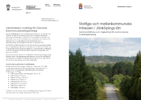
Figur 2: Förstasidorna av Länsstyrelsens planeringsunderlag till Gislaveds kommun.

Den nya lagstiftning som Länsstyrelsen omnämner i sitt yttrande till Gislaveds kommun är den nya lagstiftningen för översiktsplanering samt beredskap för klimatförändringar i plan- och bygglagen (PBL) och förändringarna kring miljöbedömningar och miljökvalitetsnormer i miljöbalken (MB) samt införandet av barnkonventionen i svensk lag.