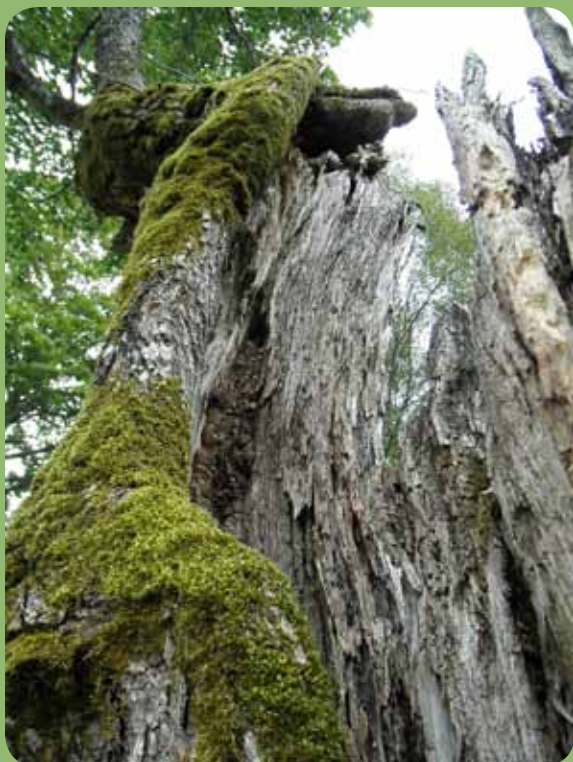
I och på gamla, ihåliga träd trivs många olika växt- och djurarter. Denna lönn står på det som tidigare var gårdsplan på gården Broaryd Lilla.