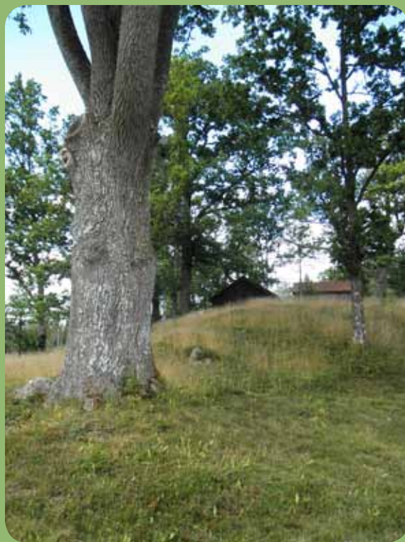
Denna ek vid hembygdsgården är den näst största som mätts in i Broaryd. Eken har en omkrets på 430 cm.

Informationen från trädinventeringen kommer bland annat att användas vid samhällsplanering och vid planering av skötselinsatser på kommunens mark.