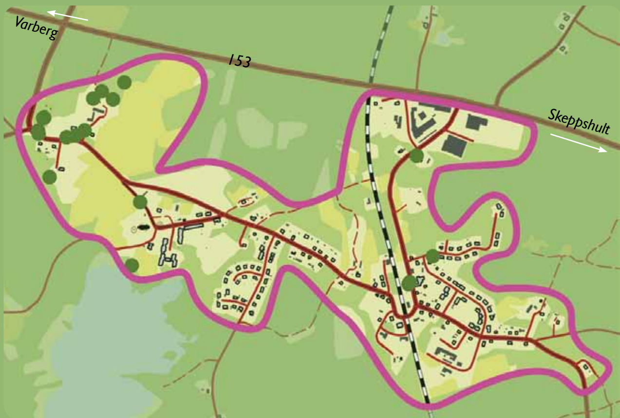
Kartan visar gränsen för inventeringsområdet och positionen för de 18 jätteträd som mätts in i och kring Broaryd. Jätteträd har en diameter på 1 m eller mer (dvs. en omkrets på över 314 cm).

Vid inventeringen noterades bland annat trädens omkrets, skötselbehov och karaktärsdrag. Det största trädet som mätts in är en ek med omkretsen 456 cm (se tabell nedan). Sammanlagt har ca 80 alléträd, 80 hålträd och 10 döda träd mätts in. Bland de inventerade träden finns 13 trädslag representerade.