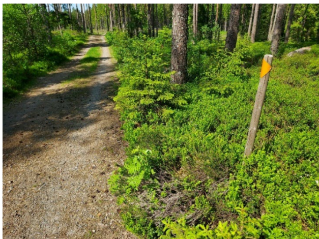
Figur 2: Foto på ledmarkering längs Gislavedsleden