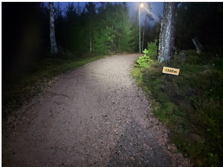
Figur 1: Foto från elljusspåret i Ås