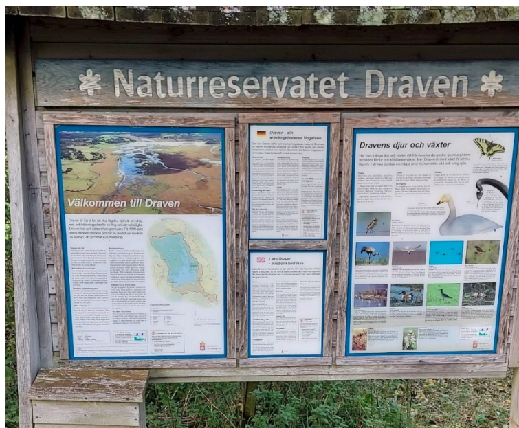
Figur 5: Informationsskylt från Dravens naturreservat

De naturreservat som bedöms nyttjas mest utifrån friluftslivssynpunkt är Isaberg, Ettö, Värö, Fegen, Draven, Villstad Kyrkby och Anderstorps Stormosse.