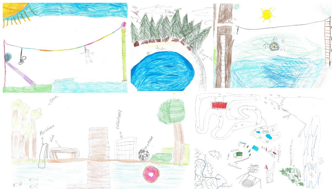
Figur 6: Exempel på teckningar som barnen har ritat över "min drömplats i naturen"

Eleverna på Ekenskolan, Klockargårdsskolan och på anpassad gymnasieskola fick i uppgift att rita sin drömplats i naturen. De populäraste motiven var träd, skog, vattendrag, grillplats i skogen, hinderbana i skogen, lekplats, linbana, skatepark, djur, berg och fotbollsplan.