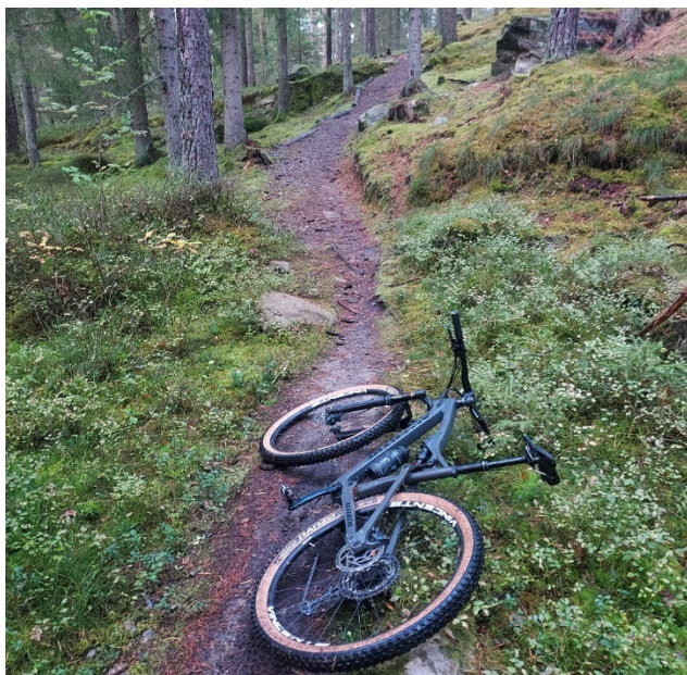
Figur 3: Foto från MTB-led "Jonsbobanan" i Anderstorp