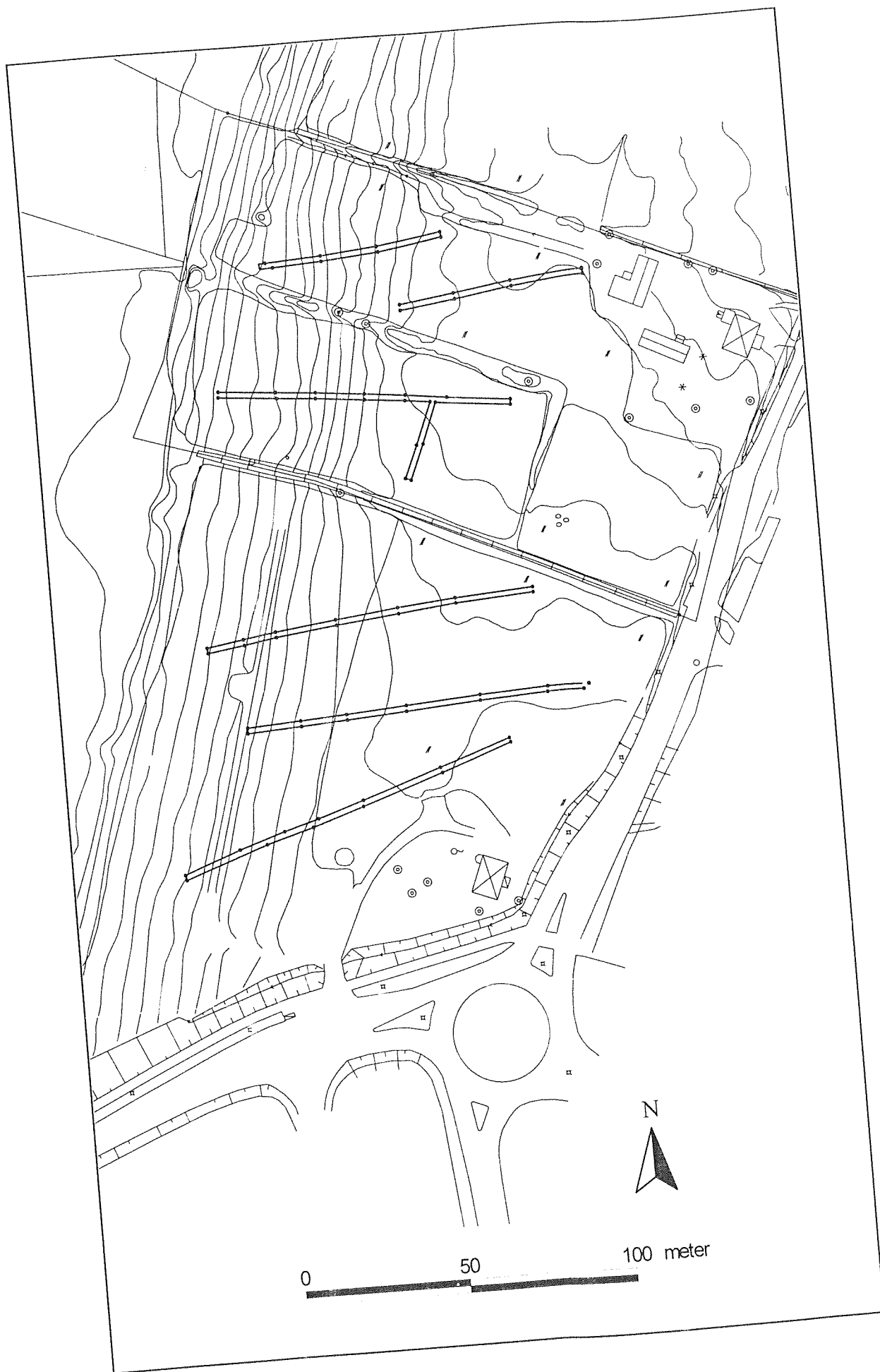
Figur 2. Planområdeskarta med sökschakten markerade.